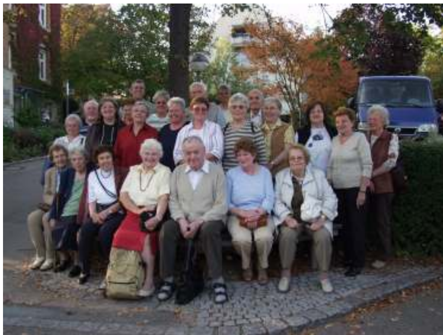
Senioren- und Gemeindeausflug ins Diakoniewerk Stetten. 12.10.06