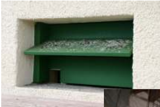
Die „Vogelwohnung“ von außen...

... und von innen, im Turm, ober- halb der Glocken